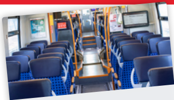
Allgemein: Sieht aus wie neu

In puncto Fahrgastinformationen gibt es gleich mehrere Verbesserungen. Zum einen erscheinen sie auf deutlich größeren Monitoren, die neu positioniert, eine bessere Lesbarkeit für die Fahrgäste garantieren. Zum anderen sorgt eine klar gestaltete Struktur der Fahrgastinformation für eine gute Übersicht über die Fahrzeit- und Anschluss-Informationen, die wie gewohnt in Echtzeit abgebildet sind.