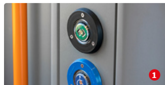
Sicherheit: Immer an erster Stelle

Unsere Talent-2-Züge werden für den künftigen Einsatz im Netz Elbe-Spree einer sichtbaren Auffrischung unterzogen. Sitze, Fußboden, Haltestangen und das gesamte innere und äußere Erscheinungsbild sind wie neu. Zu den Qualitäten gehören nun auch WLAN sowie mehr Platz für Fahrräder und Gepäck.