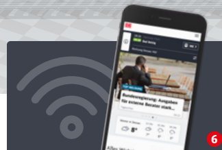
WLAN: Weltweit unterwegs

Auch für die 2. Klasse gilt: Durch eine veränderte Anordnung der Sitze gibt es für die Fahrgäste mehr Platz. Die Sitze sind fast wie neu und sorgen mit klappbaren Armlehnen sowohl zum Gang hin wie auch zwischen den Sitzen für mehr Bequemlichkeit. Größere Tische mit integriertem Abfallbehälter garantieren mehr Beinfreiheit. Zusätzliche Steckdosen sind unterhalb der Fenster angebracht und von jedem Sitzplatz aus gut erreichbar.