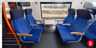
2. Klasse: Bewegungsfreiheit für alle

Wer gerne noch mehr Platz und Komfort genießt, wird sich in der neuen 1. Klasse wohlfühlen. Dafür sorgt eine veränderte Anordnung der Sitze, die mehr Platz für die Fahrgäste bietet. Auch die 1.-Klasse-Sitze selbst werden erneuert. Sie sind jetzt breiter und individuell verstellbar. Somit wird alles noch bequemer.