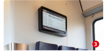
Fahrgastinformation: Übersichtliche Strukturen auf großen Monitoren

Außen lenken große, weithin sichtbare Piktogramme Fahrgäste mit Fahrrad, Rollstuhl, Kinderwagen oder sperrigem Gepäck in die Multifunktionsbereiche. Die werden einigen Umbauten unterzogen, um mehr Platz speziell für Fahrräder zu schaffen. Fahrradintarsien auf dem Fußboden weisen den Bereich explizit aus und haben darüber hinaus eine lange Haltbarkeit. Für ein sicheres Abstellen werden Anlehnstangen installiert. Hochwertige Edelstahlstreifen als Schramm- und Beulenschutz sowie Edelstahlhülsen an den Haltestangen im Ausstiegsbereich schützen den Innenraum vor Beschädigung.