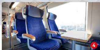
1. Klasse: Reisen zum Wohlfühlen

Wer gerne noch mehr Platz und Komfort genießt, wird sich in der neuen 1. Klasse wohlfühlen. Dafür sorgt eine veränderte Anordnung der Sitze, die mehr Platz für die Fahrgäste bietet. Auch die 1.-Klasse-Sitze selbst werden erneuert. Sie sind jetzt breiter und individuell verstellbar. Somit wird alles noch bequemer.