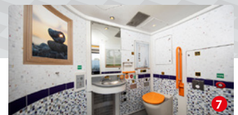
WC-Bereich: Ansprechender Look am stillen Örtchen

Die wohl wichtigste Neuerung für die Fahrgäste: Alle Züge werden über einen kostenlosen WLAN-Netzzugang verfügen. Das heißt, Bahn frei für das Internet in den Talent-2-Zügen. Zusätzlich kann im Zugportal auf Informationen zur aktuellen Fahrt, auf ein umfassendes Unterhaltungsprogramm sowie vielfältige regionale Inhalte zugegriffen werden.