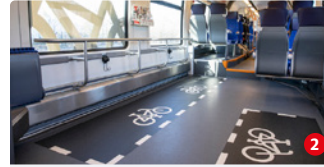
Multifunktionsbereich: Wo Fahrrad draufsteht, sind Stellplätze drin

Die Doppelstockwagen und die Talent-2-Fahrzeuge werden zu einer hochmodernen Flotte umgebaut. Eine große Herausforderung für die Fahrzeuginstandhaltung, aber grundlegend für einen nachhaltigen Verkehrsbetrieb. Komfortablere Sitze, WLAN und viel Stellplatz für Fahrräder und Kinderwagen – das sind nur einige der neuen Servicemerkmale unserer Züge. Und in den Linien zum Flughafen BER ist künftig besonders viel Platz für Ihr Reisegepäck.